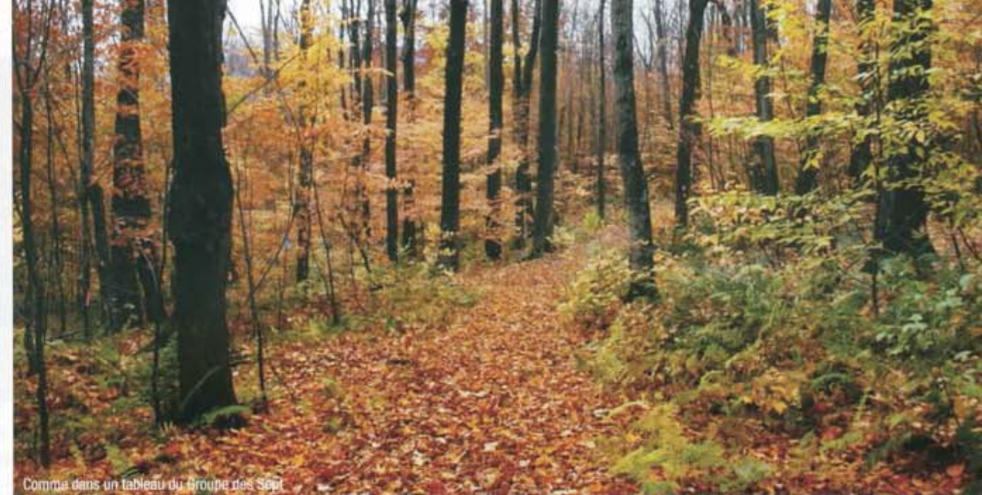
Comme dans un tableau du Groupe des Sept