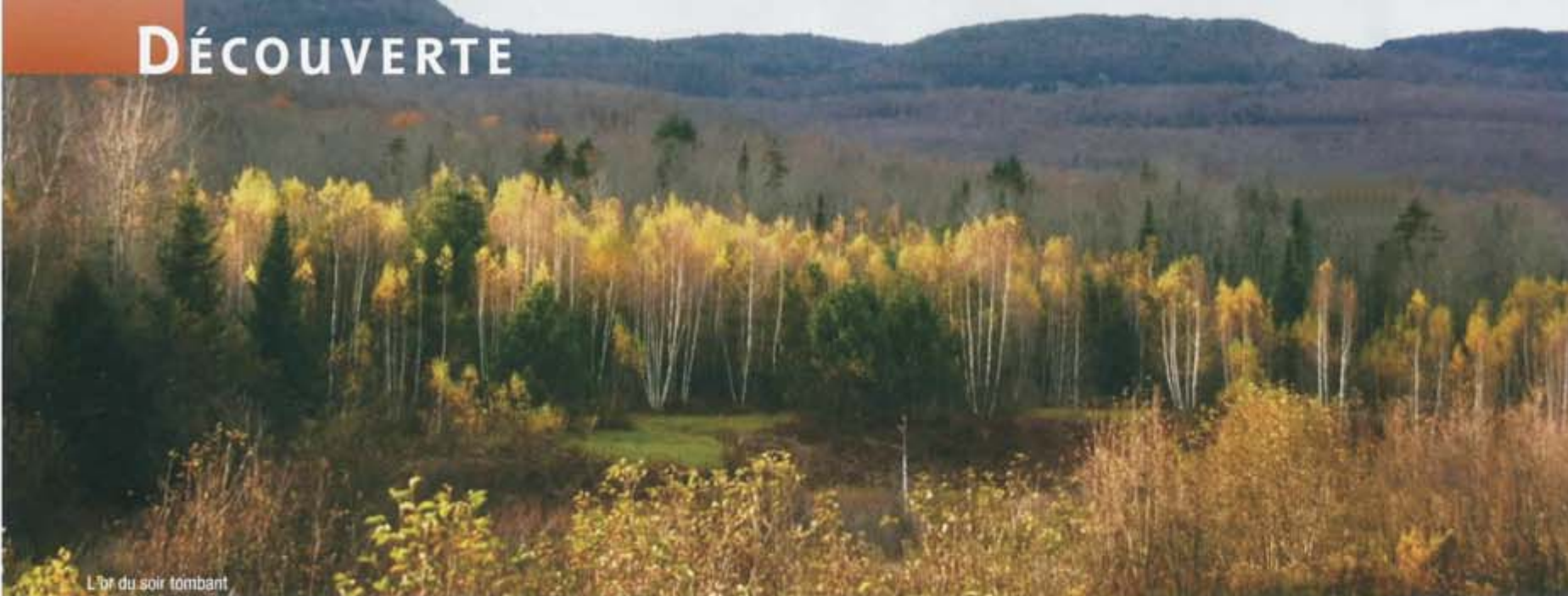
L'or du soir tombant