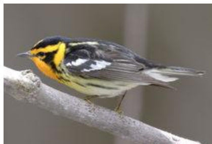
Paruline à gorge orangée (Dendroica fusca).

Sa propriété d'une vingtaine d'acres, dont une partie longe le ruisseau Ruiters, est essentiellement forestière. « J'adore ma forêt qui abrite une quinzaine d'espèces d'oiseaux nicheurs dont la paruline à gorge orangée qui est considérée en déclin dans le corridor naturel des Appalaches.