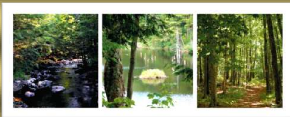
Photos: Landscapes S.Plantenga Trout Lily and photo of Stansje & Guy M.C.Planet